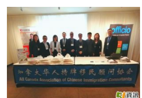
加拿大华人持牌移民顾问协会首届年会成功举行